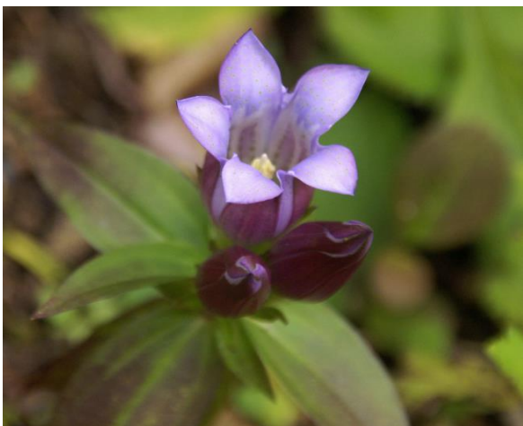
高尾山のリンドウ

主な著書として「高尾山花だより!」、「高尾山花名さがし」、「高尾山おもしろ百科」などがある。